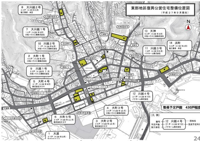
【別資料 24 ページ】