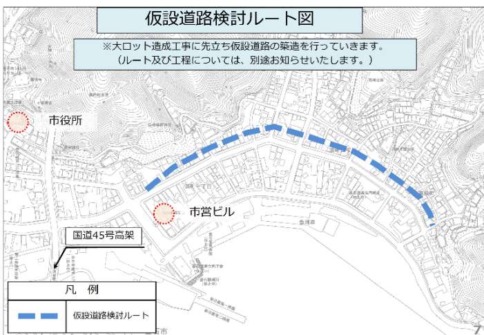
【別資料 7 ページ】