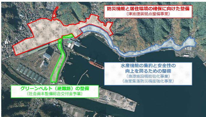
【別資料 5 ページ】