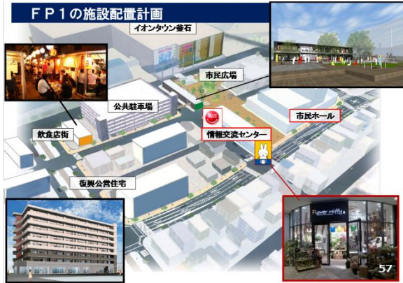
【別資料 57 ページ】