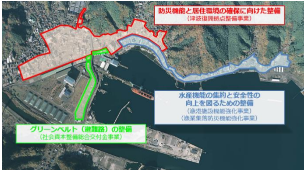
【別資料 5 ページ】