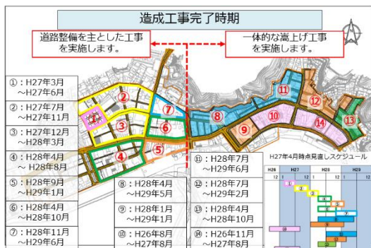
【別資料 19 ページ】