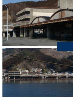
【定置網漁業を中心とした沿岸漁業の水揚げ拠点として】