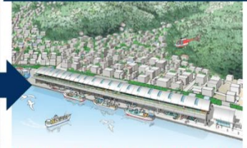
衛生管理に配慮した「新鮮・いきいき・環境の新世代魚市場」 【魚河岸地区荷捌き施設 整備イメージ図】