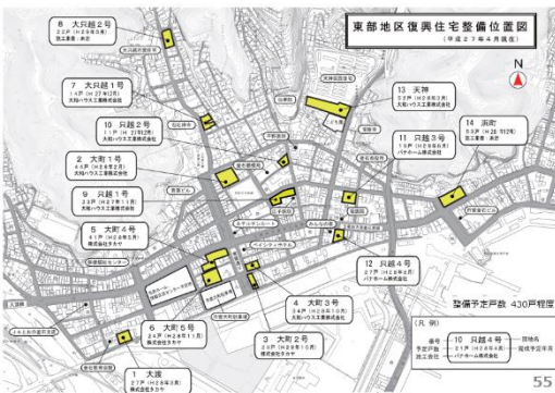
【別資料 55 ページ】