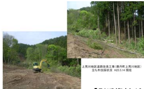
【別添資料 10～12 ページ】