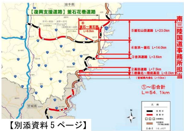
【別添資料 5 ページ】

南三陸国道事務所からは事業を行っている復興道路（三陸沿岸道路）、復興支援道路（釜石花巻道路）の工事状況について説明していただきました。現在は、緊急車両が通れるように道路の幅を広げる整備等を行っています。また、三陸沿岸道路（吉浜～釜石）の上荒川地区道路改良工事では立ち木の伐採などが始まっています。