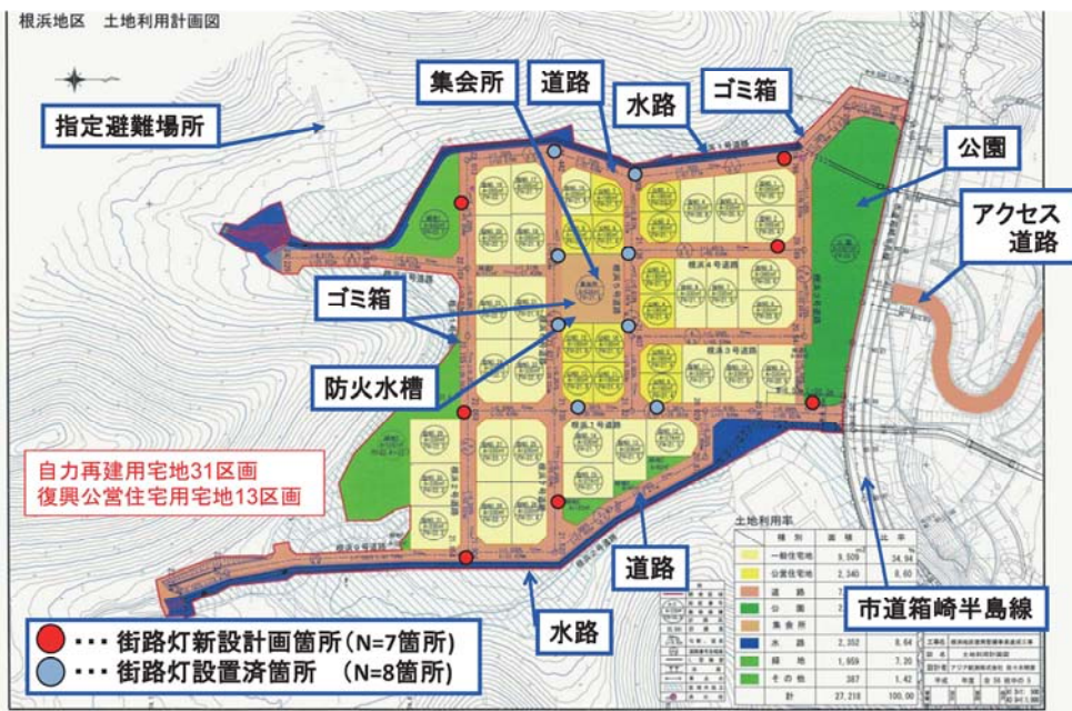
根浜地区 最新の土地利用計画図