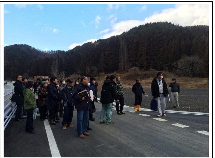
【当日に行われた現場見学会の様子】