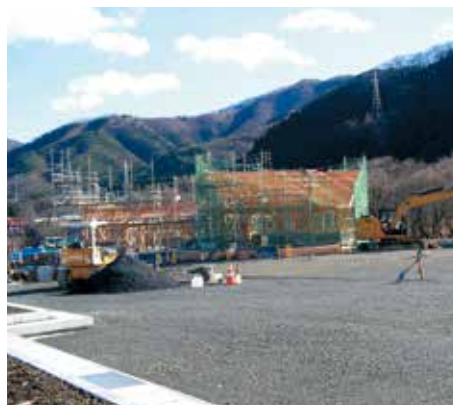
建設中の多目的棟とトイレ棟