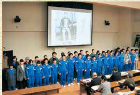
鉄の学習発表を行う釜石東中学校の生徒

シンポジウムを通して、釜石の鉄の歴史を振り返り、橋野鉄鉱山の意義や価値を再認識しながら世界遺産登録への機運を高める一日となりました。