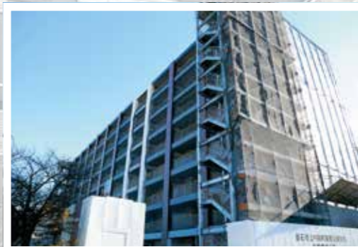
建設が進む上中島町復興公営住宅Ⅱ期