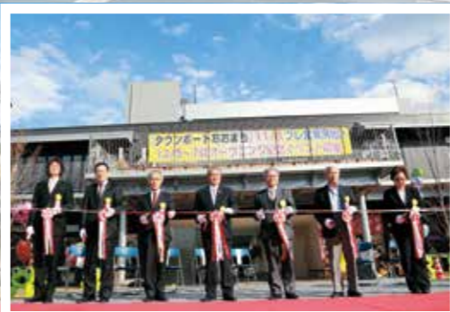
昨年12月にオープンしたタウンポート大町