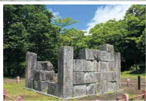
世界遺産登録を目指す橋野鉄鉱山