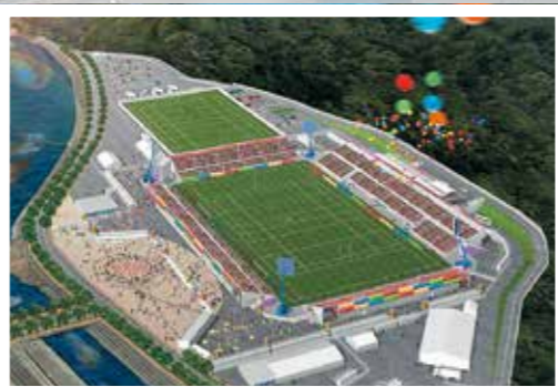
ラグビーワールドカップ2019誘致へ