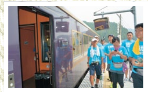
三陸鉄道で次の目的地:大船渡へ