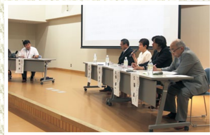
パネルディスカッションで意見を述べる発表者

東日本大震災では指定の避難所以外にも、自主的に臨時の避難所が開設されました。約80名の参加者が集まった今回のフォーラムでは、民間の福祉施設の事例を題材として、サービス利用者および既入居者のケアと避難者受け入れの両立など、今後の避難所運営体制はどうあるべきか話し合いました。会場からは運営時の経費、家族への引き渡しのタイミングや土砂災害時の対策などについて質問があり、議論が深められました。