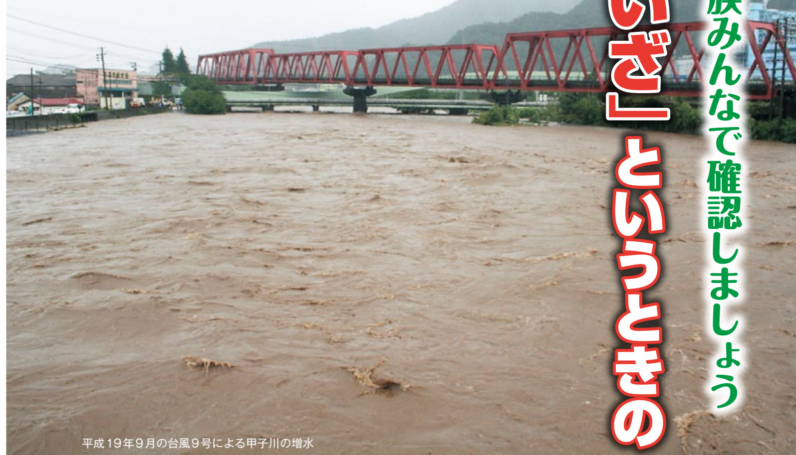
平成19年9月の台風9号による甲子川の増水

毎年のように全国各地で記録的な大雨が発生し、河川のはらんや土砂災害などの被害をもたらしています。特に、今年の8月20日、広島市で局地的な大雨による大規模な土砂災害が発生し、住宅が巻き込まれ多くの住民が亡くなるなど、甚大な被害が出ました。