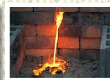
勢いよく流れ出るノロ(鉄滓)