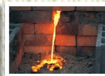
勢いよく流れ出るノロ(鉄滓)