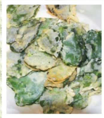
ミズアオイの天ぷら