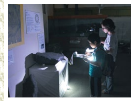
夜の資料館を探検する親子