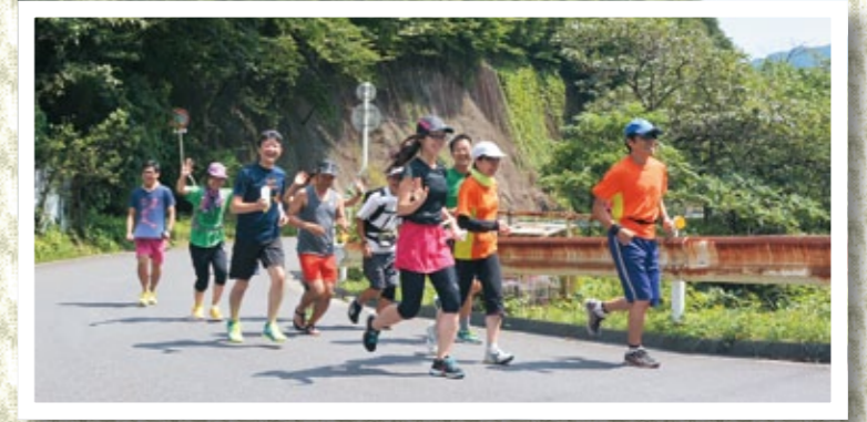
県道水海大渡線を走る参加者たち