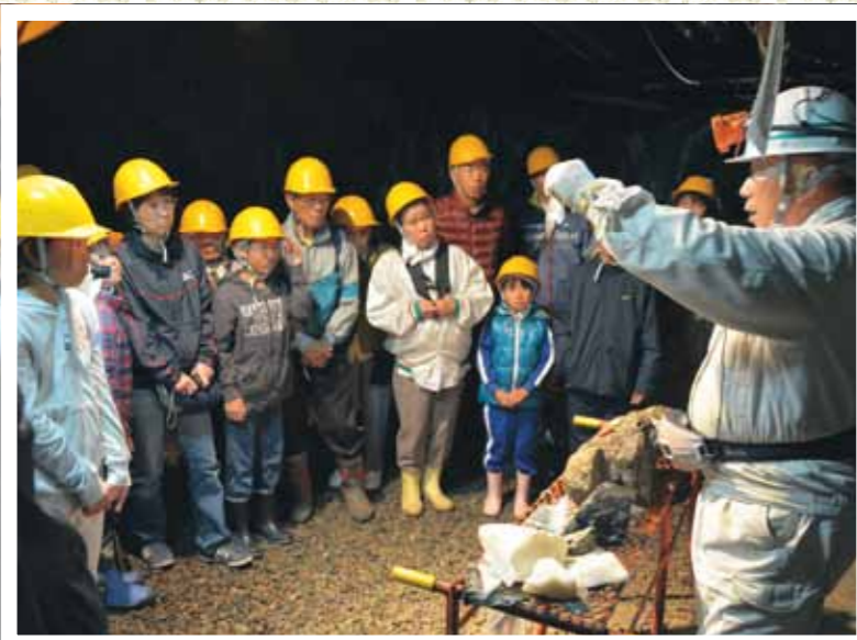
鉱山でとれる岩石や鉱物の説明を受ける参加者たち

今年も鉄のふるさと釜石創造事業として、釜石鉱山坑道見学会が開催されました。見学会の内容は、トロッコによる坑道内の見学、旧釜石鉱山事務所展示室の見学、鉄に関する史跡の見学など。坑道内は気温が約10℃と、まるで天然の冷蔵庫となっています。坑道内では、参加者はトロッコの揺れを楽しんだり、ナチュラルミネラルウォーター「仙人秘水」の原水を飲んだり、天然の音響室で音楽を聞くなど、この日しか体験できない特別な時間を過ごしました。