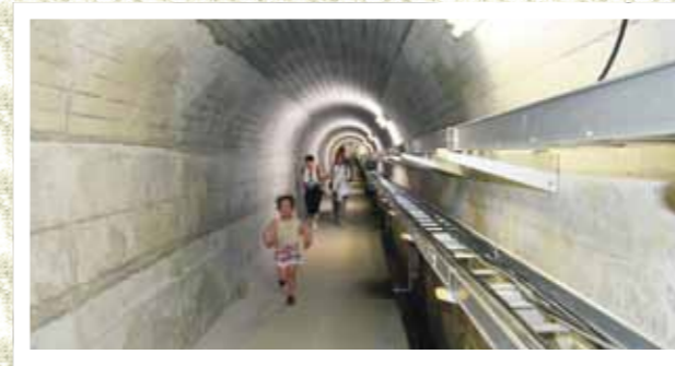
ダム施設内の見学の様子

国土交通省および林野庁が定めている「森と湖に親しむ旬間」(7月21日~31日)に、毎年恒例の湖畔の集いが開催されました。ダム施設の一般公開では、参加者は約13℃とひんやりしたダム内部で涼みながら、施設を見学しました。ニジマスのつかみ取りでは、子どもたちがプール内ですいすい泳ぐ魚に苦戦しながらも、楽しそうに魚をつかまえ、その場でおいしくいただきました。なお、この旬間中にはダムのライトアップも行われました。