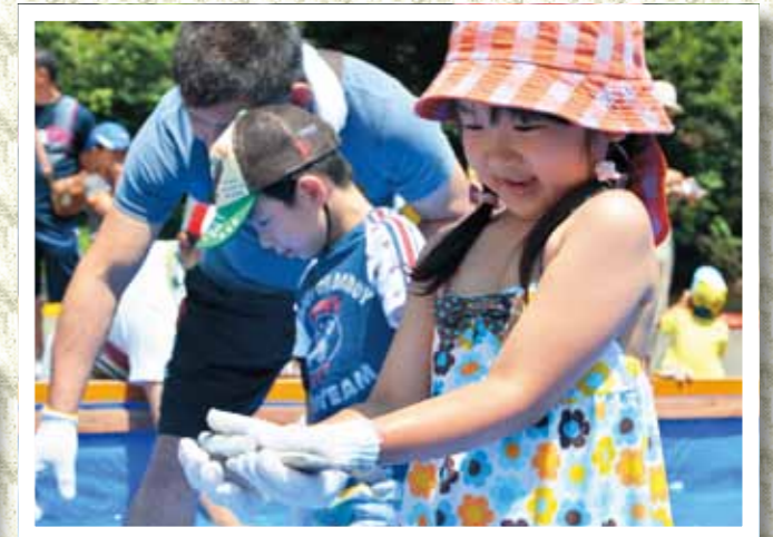
ニジマスをつかまえた子ども