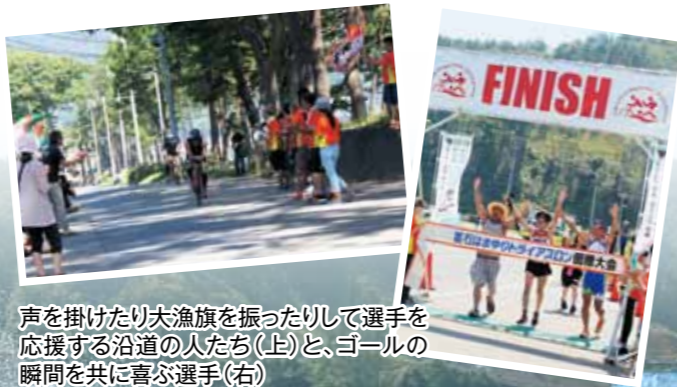
声を掛けたり大漁旗を振ったりして選手を応援する沿道の人たち(上)と、ゴールの瞬間を共に喜ぶ選手(右)

釜石を象徴するスポーツ大会の一つ「釜石はまゆりトライアスロン大会」が、市内外の多くの人たちの支援により、4年ぶりに「スイム（水泳）」「バイク（自転車）」「ラン（長距離走）」の3種目で復活しました。競技の距離は震災前の半分と規模を縮小しての開催でしたが、北は青森県から南は岡山県まで全国から約130人が参加。選手は炎天下の中、いまだ震災の爪跡が残るコースを力いっぱい走り抜け、その姿に沿道のボランティアや観客が温かい声援を送りました。2016年の「いわて国体」ではトライアスロン競技の会場になっている同地区。2年後の国体成功に向け、大きな弾みとなりました。