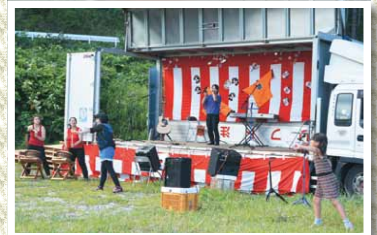
歌と太鼓と飛び入りのダンスの共演

震災後、海から離れた生活が続く中、海を嫌いになってほしくないという願いと音楽をみなさんに楽しんでほしいという思いから、有志の実行委員によって海の日片岸海岸で音楽祭が開催されました。会場にはキッチンカーも駆けつけました。仮設ステージでは、高校生、アマチュアバンドからプロまで、多くのキャストが演奏し、片岸の青い海、青い空に歌声が響きました。