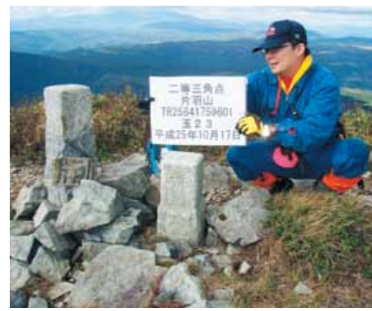
測量基準点の調査の様子

市では、昭和57年度から国土調査(地籍調査)を行っています。地籍調査とは、国土調査法に基づく3つの「国土調査」の一つで、一筆(土地登記簿上の一区画)ごとの土地の所有者、地番、地目を調査し、境界の確認と面積測量を行うものです。「地籍」とは、いわば土地に関する戸籍であり、地籍調査の成果として地籍図と地籍簿が作成され、登記簿の記載修正や地図の更新、固定資産税算出の基礎情報などに活用されます。今月号では、市の地籍調査の概要や取り組み状況などについてお知らせします。