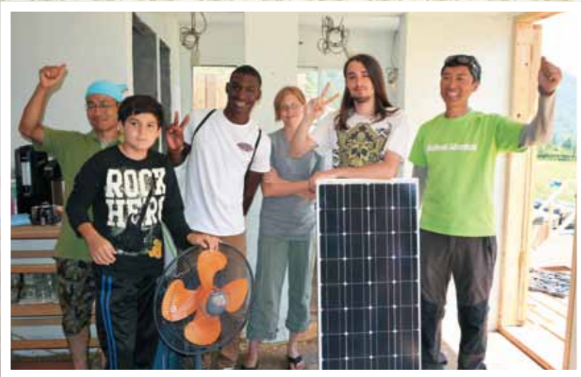
橋野のエコハウスにてソーラー発電で扇風機を回しました