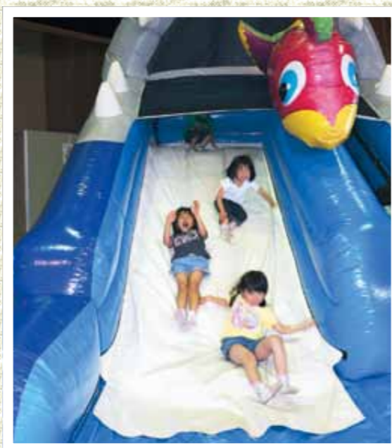
楽しく滑る子どもたち

「子どもたちが夢中で遊べる場所や親子で安全に遊べる場所が欲しい」という未就学児を持つ親からの声にこたえるため、室内に遊び場をつくり、親子で元気に思いきり体を動かして楽しむイベントが開催されました(東日本大震災いわて子ども支援センター主催)。大きな滑り台、ボールプール、プラズマカーなどの遊具やベビーヨガ、ロデオヨガなどのコーナーが用意され、子どもたちは、次々に遊具を変えながら、元気いっぱい遊びました。