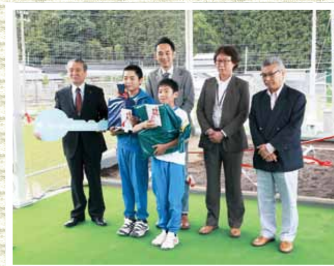
「みんな」が待ちに待ったうれしいオープン

ナイキからの寄付とArchitecture For Humanityの協力によって、4棟目となる「みんなの家」がオープンしました。子どもたちの意見を聞きながら設計された『釜石「みんなのひろば」(クラブハウス)』は、鉄骨2階建てで、1階には2つのロッカールームや、みんなが集まれるサロンとして使える休憩室、2階は屋根付きのテラスがあり、ピッチング練習や試合時には応援テラスとして活用することができます。子どもたちのスポーツ活動や保護者たちの交流の場として、さらには地域の方々のコミュニティー活動の拠点になることが期待されています。