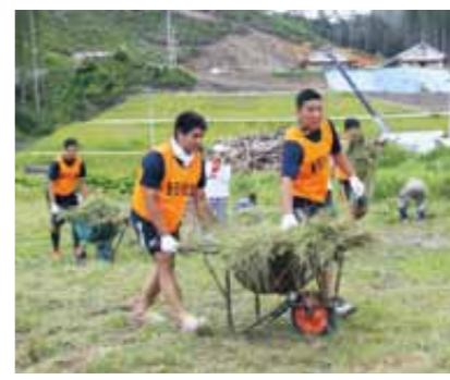
ボランティア活動に訪れたラグビー高校日本代表候補選手たち（6月28日根浜）