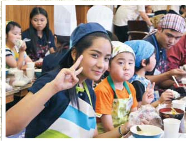
タイ料理と日本食を通じて触れ合うタイの大学生と子どもたち