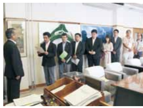
野田市長にワールドカップ開催都市立候補を要請する釜石誘致推進会（6月30日）

世界トップレベルのプレーを身近に体験でき、ラグビーなど各種スポーツや、ほかの分野で世界を舞台