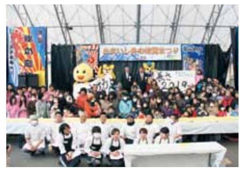
ラグビーワールドカップ2019にちなみ20.19mのロールケーキを製作（1月18日冬の味覚まつり）