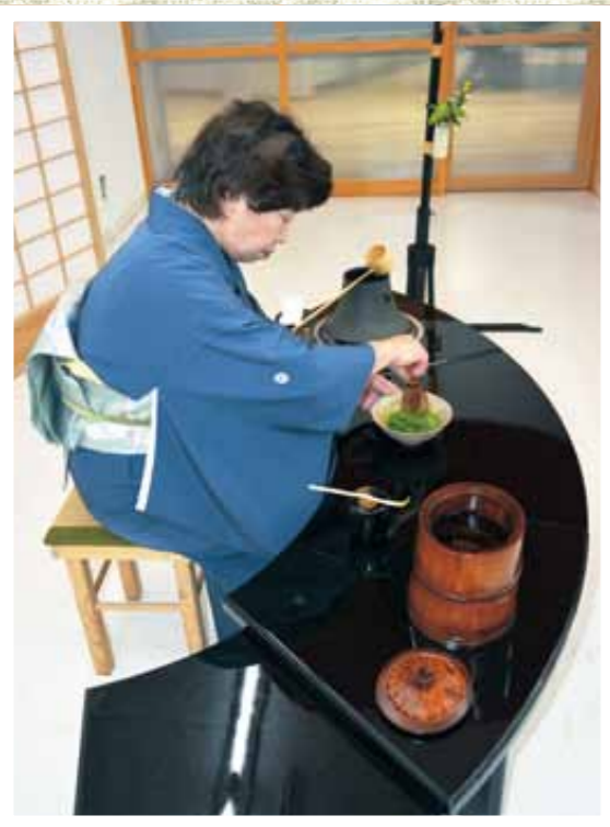
美しい所作でたてられるお茶