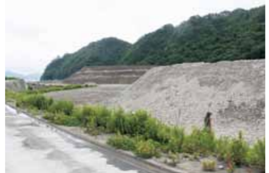
試合会場予定地の鶴住居小(手前)、釜石東中(奥)跡地の現況[下]と同地に整備するグラウンドのイメージ[上]