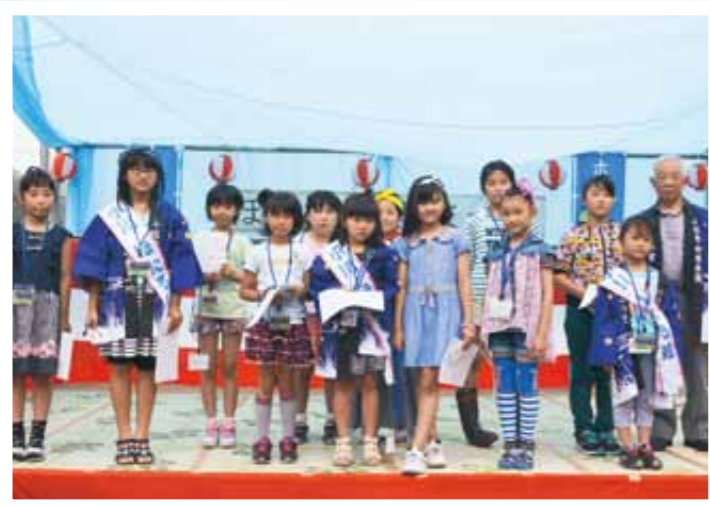
「ほたる娘」コンテスト