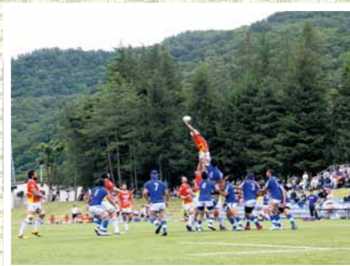
空中で見事にキャッチするシーウェイブスの選手