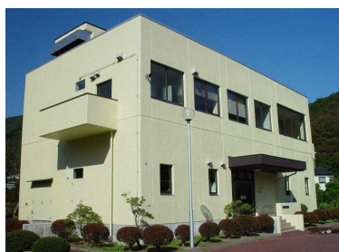
上平田処理場管理棟(左) と水処理棟(右)

昭和55年4月1日 大渡町1・2丁目、大只越町1丁目、只越町1・2丁目、東前町、浜町2・3丁目の各一部 平田町字上平田の一部 上平田下水処理場供用開始 4月1日 中妻ポンプ場機械電気設備工事271,920千円 中妻汚水幹線推進工事78,077千円