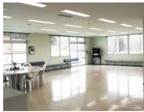
トレーニング機器を設置するラウンジ

【お詫び】2014年3月19日号広報かまいし (P4) に、建設中の鵜住居幼稚園仮設園舎として掲載した写真は、誤りでした。お詫びします。