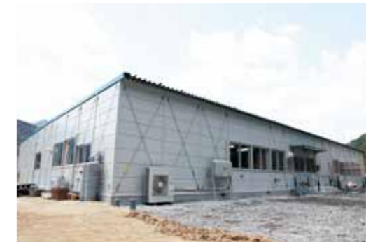
完成した鵜住居幼稚園仮設園舎

鵜住居幼稚園の仮設園舎が完成し、35人の園児を迎えて4月11日から鵜住居地区で再開しました。 鵜住居町中心部にあった同幼稚園は、平成23年の東日本大震災で園舎が全壊したため、約3年にわたり天神町にあった第一幼稚園と合同保育を行ってまいりました。このほど、鵜住居町第2地割内の用地で工事を進めてきた仮設園舎の完成に伴い、本年度から本設園舎が完成するまでの期間、仮設園舎で幼児教育が行われることとなります。