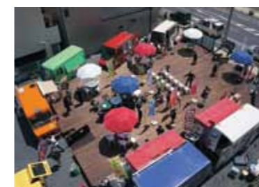
大町ほほえむスクエアは、2013グッドデザイン賞を受賞。

かまいしキッチンカープロジェクトは昨年度、全国の地方紙や共同通信社による、地域の活性化に取り組んでいる団体を表彰する賞「地域再生大賞」を受賞しました。