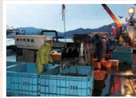
懸命な復旧で水揚げ量が徐々に回復(釜石魚市場)