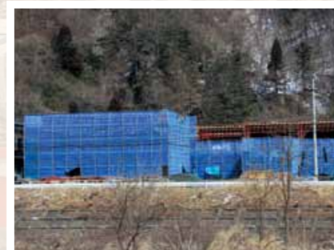
新年度供用開始へ建設中の鶴住居幼稚園仮設園舎(鶴住居町)