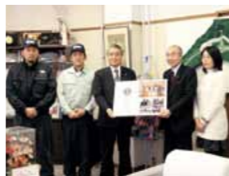
認定証を掲げる野田市市長