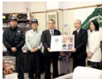
認定証を掲げる野田市市長ら