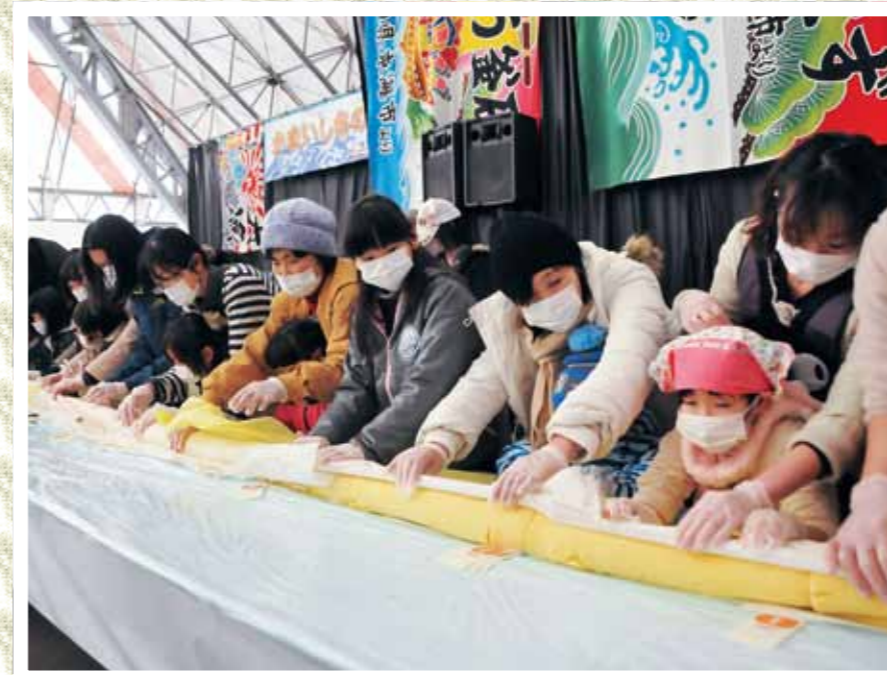
長さ20.19mのロールケーキ作りを楽しむ参加者