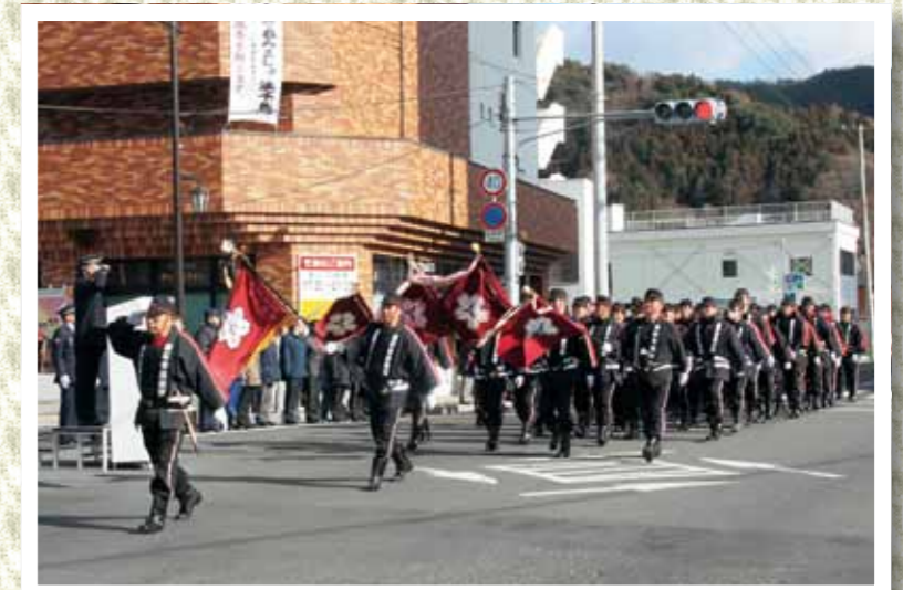
整然と行進する消防団員

シープラザ遊での式典に続き、約660人の消防団員のほか、消防車やはしご車など48台による分列行進が、3年ぶりに大町目抜き通りで行われました。団員らは沿道の市民が見守る中、力強く頼もしい姿で行進を行い、災害のない安全なまちへの心意気を示していました。