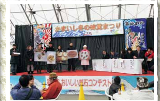
「おいしい釜石」作品を紹介する出品者