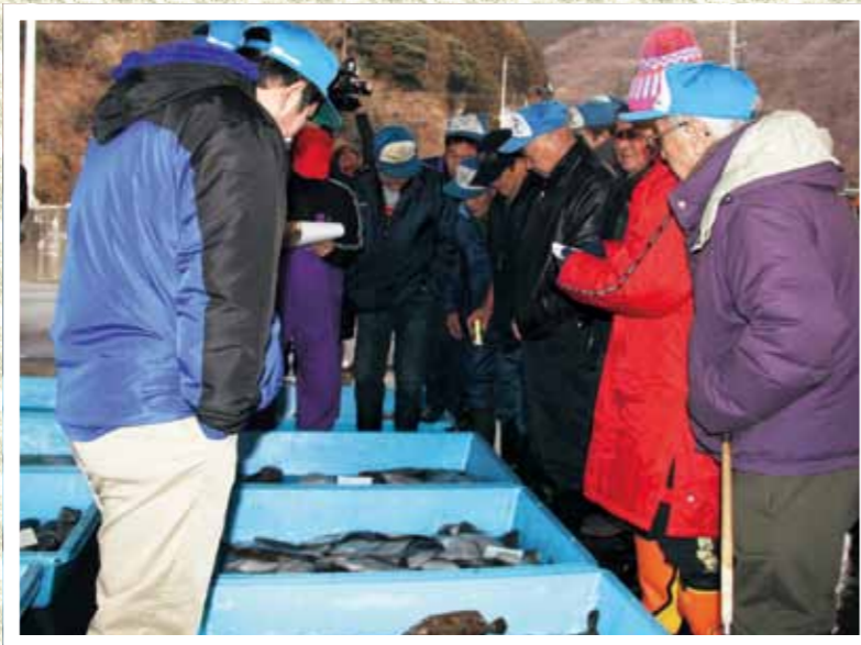
買い受け人が集まった初競り

初売り式では、魚市場関係者などが復興への決意を新たに鏡開きを行い、新年のスタートを祝いました。式の後、水揚げされたサケやスルメイカなどのケースが多数並び、早速初競りが行われ、多くの買い受け人のはつらつとした掛け声で市場は活気づいていました。