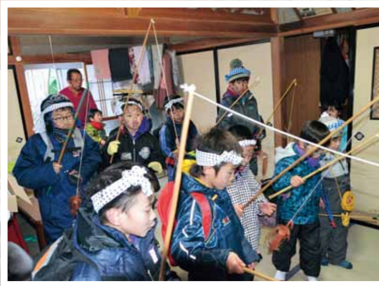
さおを振り、するめ釣りのまねをする子どもたち