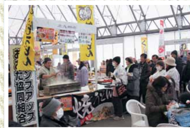
来場者でにぎわう物産展

今回から震災前の名称に戻して行われたイベントは、東海市の協力で2019年のラグビーワールドカップにちなんだ長さ20.19mのロールケーキ作り、第2回おいしい釜石コンテストも併催し盛り上がりを見せました。このほか、おなじみの横手市の出前かまくら、早食いを競う釜石ラーメン腹ペコまつり、友好都市物産展などが行われ、会場内は終日にぎわいました。