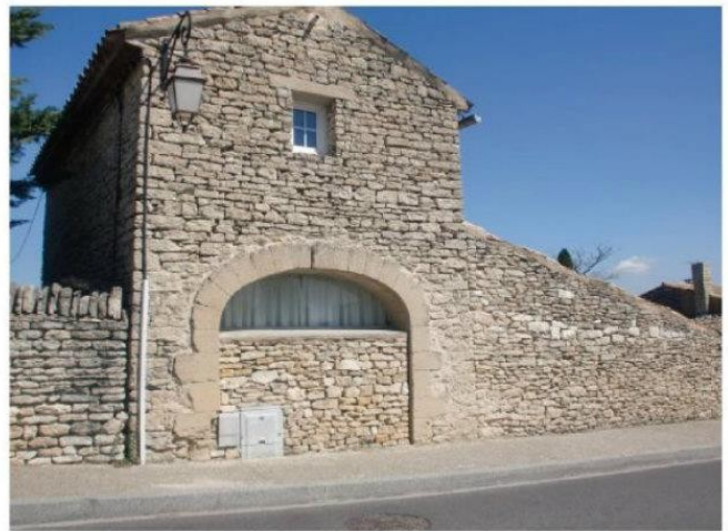
ここはルシヨンという町で、オークルの塗料がとれるので、 それを使い、家の壁が全体的に赤く塗られています。