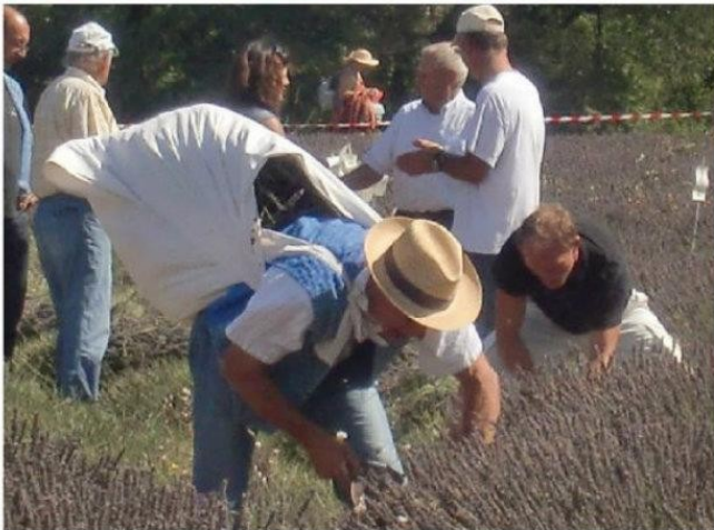
8月15日前後にはラベンダーのお花は刈り取られます。 これはラベンダーのお花を刈るお祭りで、 競争をしている所です。