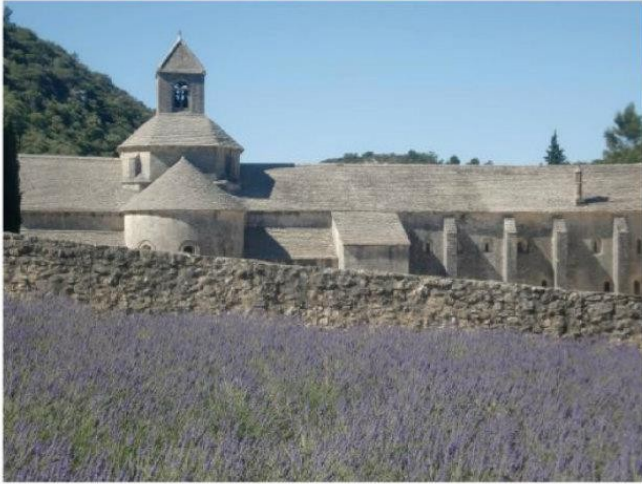
プロヴァンスにはいくつか修道院が残っています。 ここはセナンク修道院と呼ばれ、 夏はラベンダーのお花がきれいに咲きます。