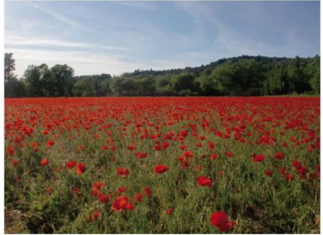
先に咲くひなげし、ポピーのお花畑。