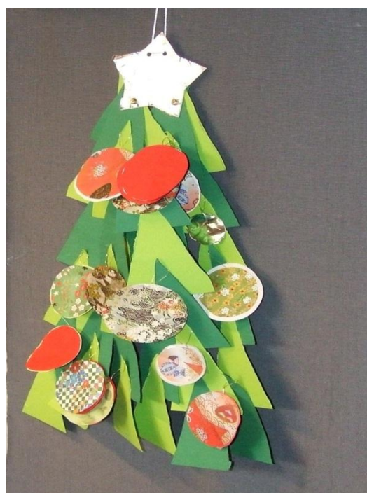
クリスマスのために作った飾り