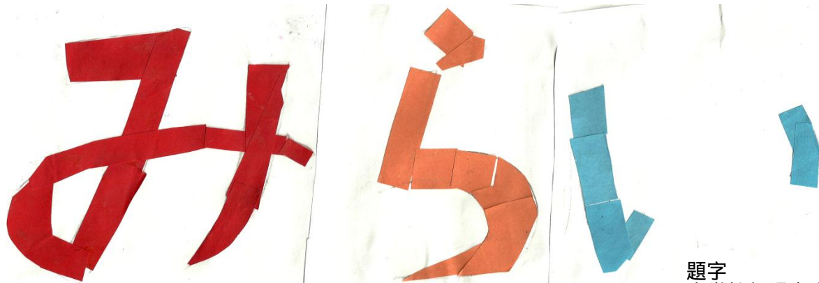
題字 小学校部児童全員