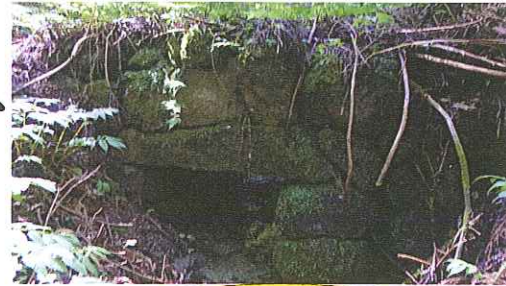
小枝街道内の石組の橋