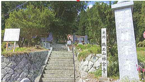
曹洞宗 鶏石山 林宗寺