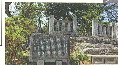
牧庵鞭牛隠居屋敷跡