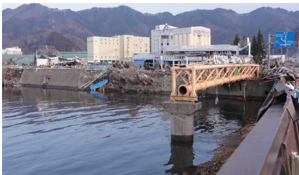
後方は三陸鉄道、その前後に流出部分が漂着