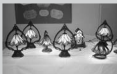
昨年度のステンドグラス展

切り絵、盆栽、山野草、リボンフラワー、切手、写真、書道、華道、ステンドグラス、ビデオ、原色押花絵、水墨画、絵画