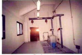
①流入 ②自動荒目スクリーン

②自動荒目スクリーン 自動荒目スクリーン 圧送されてきた汚水中から 狭雑物を取り除きます。