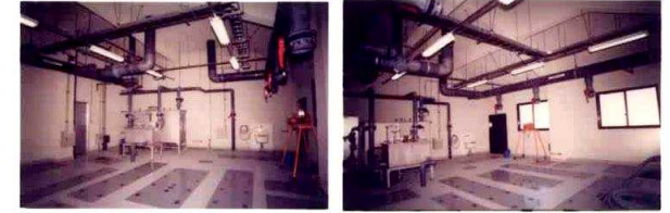
④スクリーンユニット・接触ばっ気槽

④第一・第二接触ばっ気槽 汚水中の有機物(汚濁成 分)を槽内に充填された接 触材“すだれ”の表面の好 気性微生物が分解処理し ます。