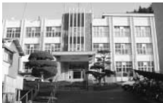
市庁舎建設に伴う跡地活用は

市長 本年三月に公表した中期財政見通しの主な大型事業の配置計画の中で、庁舎の建設年度を平成十九年度から二十年度としている。