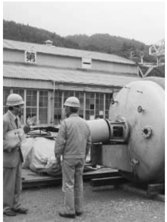
産業育成部門の企業訪問