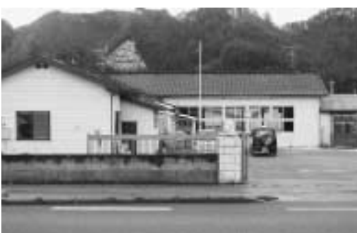
わらび学園分園予定地