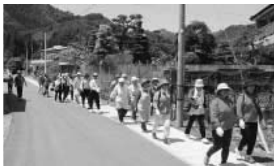
地域保健の推進を

部長 平成十五年度に民間有識者などによる策定委員会を設置し、効果的、計画的に進めたい。 議員 高齢者の居住の安定確保に関する法律が施行されている。当市の住宅政策に生かすべき。 部長 加齢対応構造等を備えた民間の賃貸住宅の整備促進に必要な施策を講ずるよう努める。 議員 福祉事務所、生活環境課、