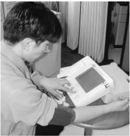
在宅健康管理システム「うらら」

助役 八月段階で話があり、職 員を調査に派遣したが、まだ具体 的な内容が詰められていない模様