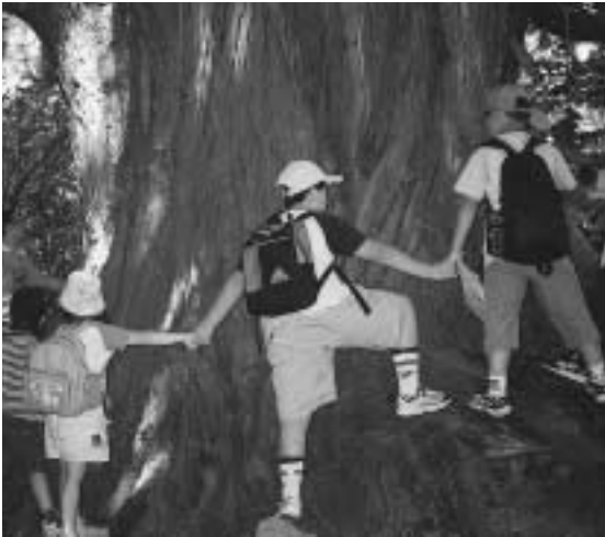
まちを愛する人材育成を

部長 当市の経済情勢を把握する上で、他市との状況比較も重要なものと考え。企業誘致における新規雇用者数は宮古市の三倍弱となっており、誘致企業で働く従業員数の割合は、釜石は42・3%、宮古は26・3%で、宮古が地場企業の比率が高くなっている。