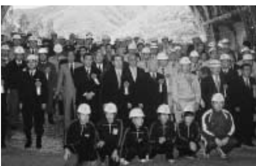
物流拠点の形成へ（仙人トンネル貫通式）

市長 第五次総合計画に基づき、高規格幹線道路の整備、釜石港の機能の高度化を軸に推進している。そのことを次期市長にも引き継ぎます。