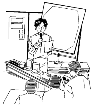
住民参加活動（ワークショップなど）

部長 県及び関係者、地元町内の協力を得ながらトイレ建設の実現に向けて進めていきたい。