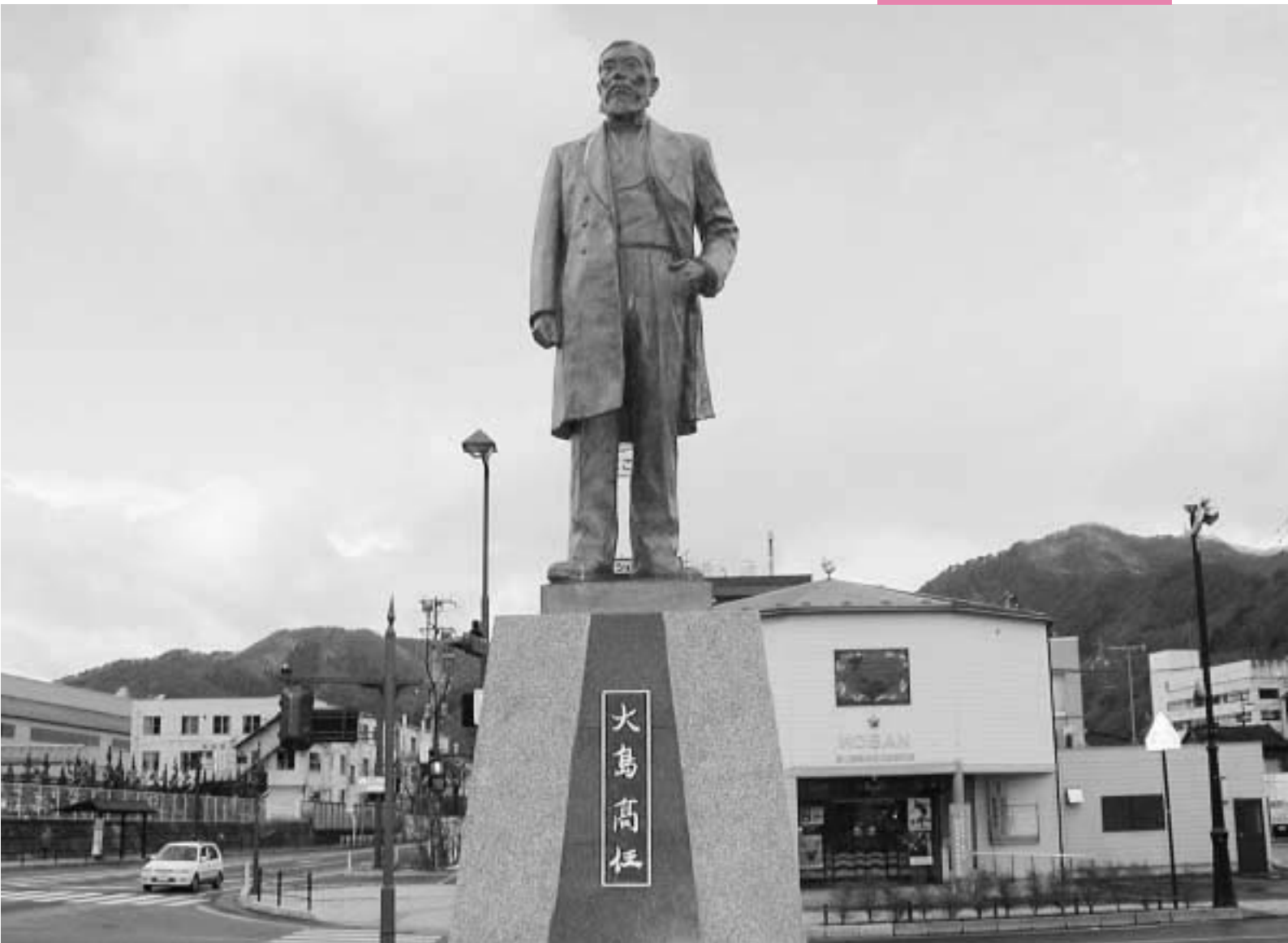
近代製鉄の父 大島高任像