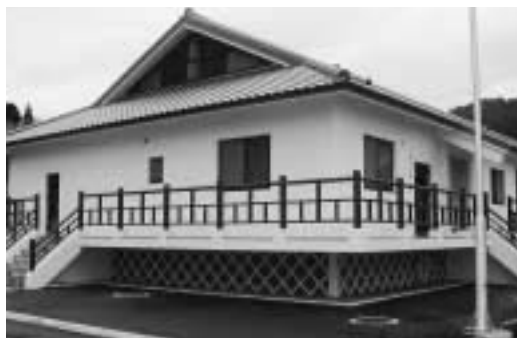
漁業集落排水処理場

議員 食の安全にトレーサビリ ティ(追跡可能性)という、いつ、ど こで、どのように生産、流通され たか等が把握できるシステムづく りが重視されているが。 部長 さきの教訓から、国、県 が制度、体制を強化している。