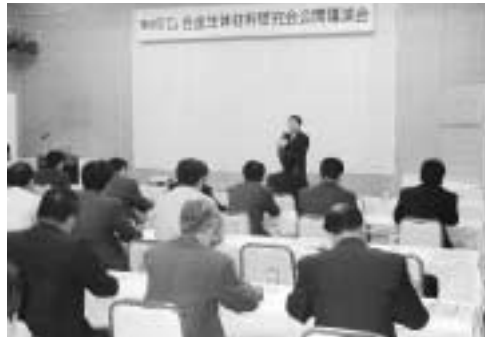
生体材料研究会の公開講演会

部長 産業育成センターが中心となり岩手大学と地場産業との産学官連携の取り組みで研究開発したもので、人工股関節や骨折用プレートは、生体適合性に優れ、極めて有望な素材である。製品化ま