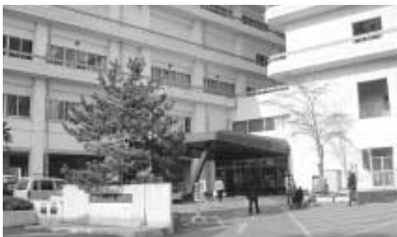
市民病院の方向性は

市長 庁議を最高経営会議とし、行政経営方針決定の場としたい。 議員 財政状況が厳しいが、大