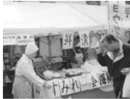
地場産品の創出に支援を

部長 この種の活動に助成しており、新たな地場産品の創出には関係機関と協力して支援していく。