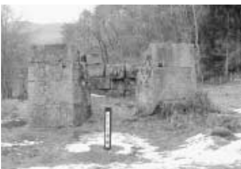
橋野高炉の復元計画は