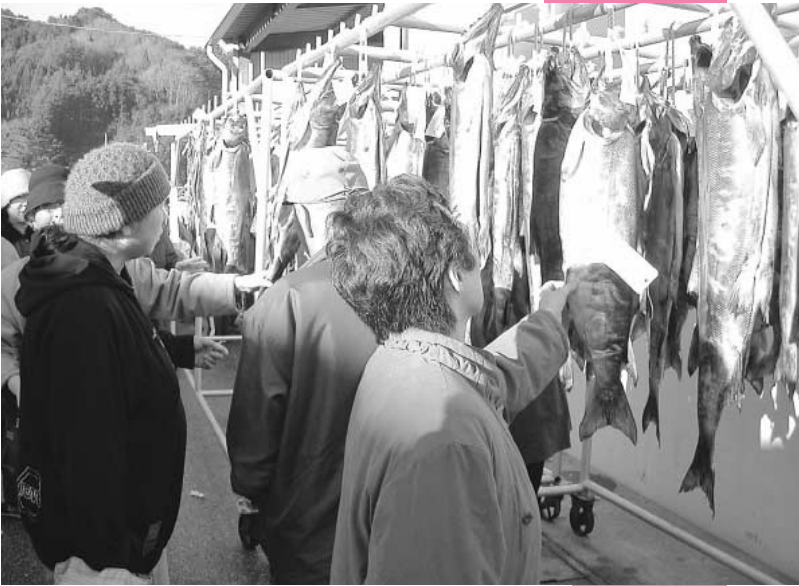
浜の朝市のにぎわい（箱崎町）