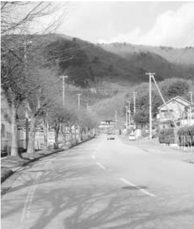
道路整備の計画は