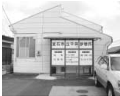
地域医療のあり方は

置、アンケート調査の実施、専門コンサルタントの調査などを行い、保健医療計画に反映させたい。