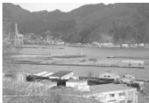
整備が進む公共埠頭

登下校時の安全対策は、中妻駐在所、交通指導隊、父母や、子供一〇番等を活用して行う。