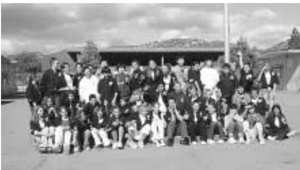
中学校の海外派遣による国際交流

部長 外山地区生活環境保全林が適地であり、鶴住居財産区や地区住民の意見を聞き、可能性を求めたい。