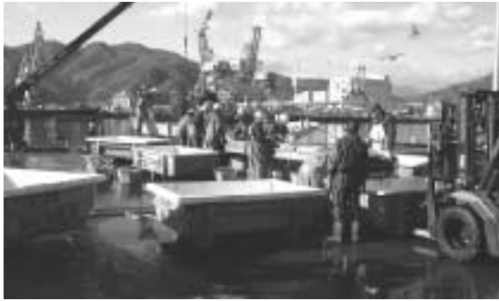
地場産業の振興は (水産課提供)