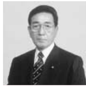
議長 平 館 幸 雄